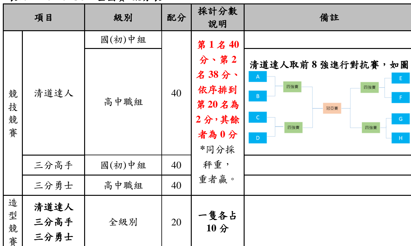
表四 Remo-Con 全國賽 配分表

6.4.4 競技競賽：則採「清道達人」40%、「三分高手(國(初)中組)/三分勇士(高中職組)」40%、造型競賽 20%計之。